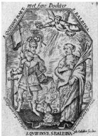
Quirinus mit seiner Tochter Balbina. Druck aus dem 18. Jahrhundert. (Abbildung ge-

Das Gedenken des Todestages des Hl. Quirinus (kleines Quirinusfest) am 30. März entfällt in der Karwoche.