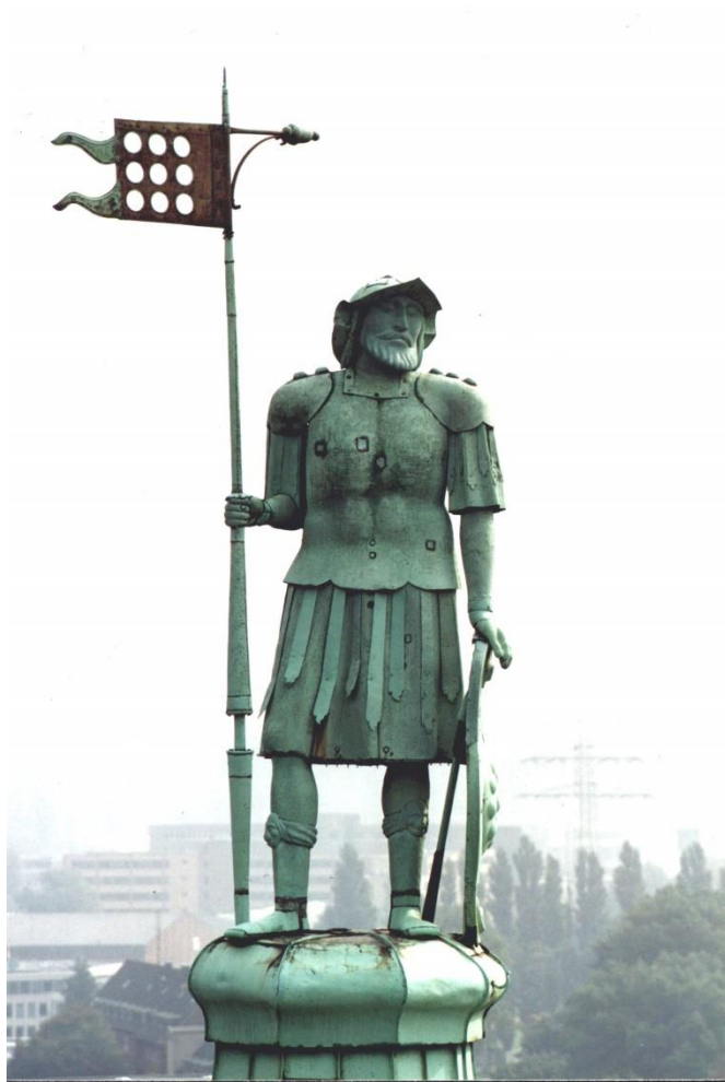
Quirinus auf der Kuppel des Münsters