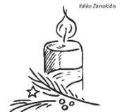
1. Advent: Die Umkehr wagen